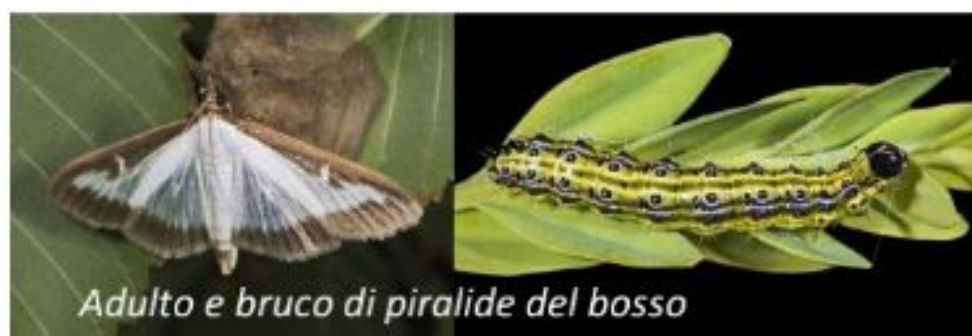
Adulto e bruco di piralide del bosso

In un anno l'insetto compie diverse generazioni. I bruchi, che compaiono a marzo/aprile, giugno/luglio e settembre/ottobre, divorano le foglie, prima solo la pagina inferiore, poi completamente, inoltre avvolgono con fili di seta alcune foglioline, formando dei nidi sericei al cui interno si riparano. Le siepi colpite possono mostrare defogliazioni più o meno spinte con disseccamenti dei rametti, cambiano colore che diventa bruno ocraceo o grigiastro e finiscono per deperire. Se osservate i danni di questo insetto, bisogna intervenire con prodotti insetticidi microbiologici come Bacillus thuringensis oppure a base di Emamectina