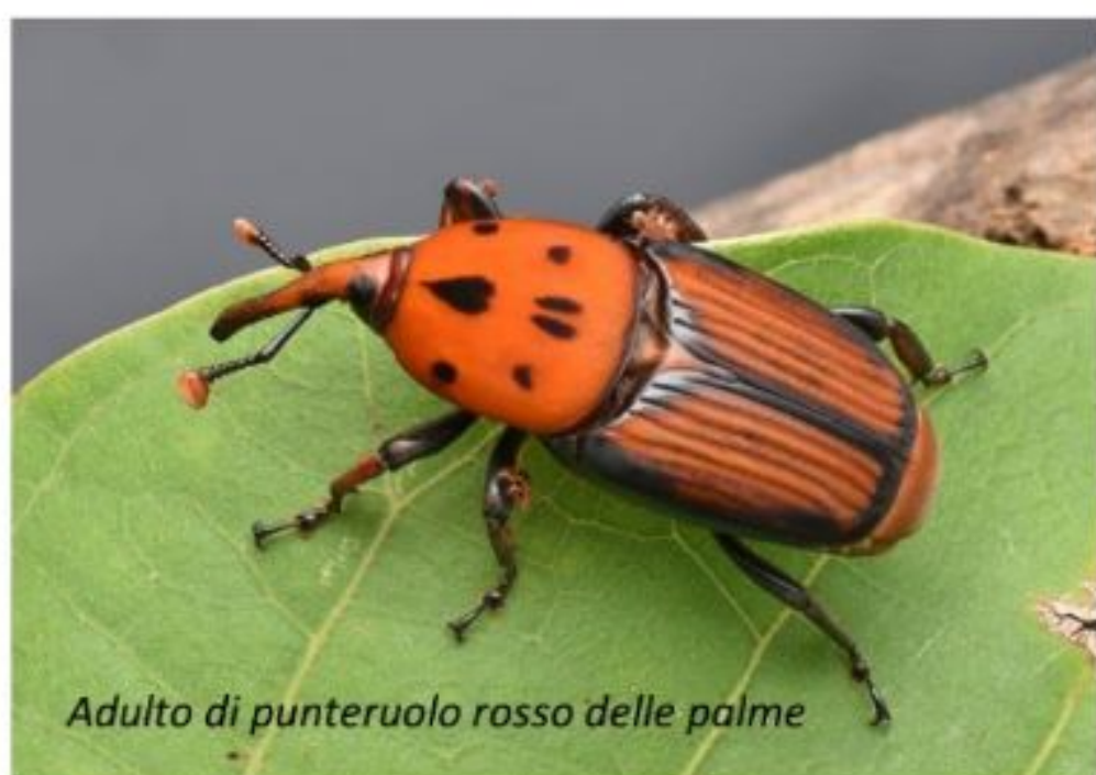
Adulto di punteruolo rosso delle palme

Vogliamo fare qualche esempio a tutti ben noto? Prendiamo il punteruolo rosso delle palme (nome scientifico Rhynchophorus ferrugineus ). Originario del Sud-est asiatico, è ormai ben insediato nella maggior parte dei paesi del Mediterraneo. In Italia è arrivato una ventina di anni fa e da allora non si contano le palme che sono morte a seguito dei suoi attacchi. Si tratta di un coleottero di colore rossiccio e dimensioni ragguardevoli (3-4 cm), le cui larve si nutrono di molte specie di palme, scavando gallerie all'interno del fusto, fino ad arrivare all'apice della