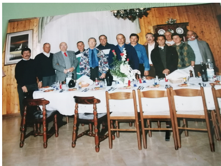
Foto di gruppo del primo Direttivo dell'Associazione Contrade Termoli Nord nel 1995

Ricordo ai soci che l'Associazione denominata Contrade Termoli Nord quest'anno raggiunge un traguardo importantissimo, che poche associazioni possono vantare. Siamo infatti a 25 anni dalla fondazione e festeggiare questo traguardo era, per il consiglio, una priorità!