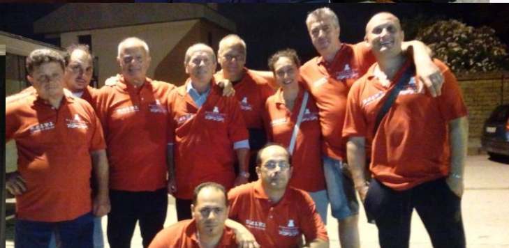
Direttivo 2014... tra tanti maschietti per la prima volta una quota rosa