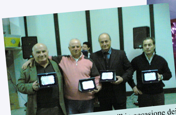
Premiazione ai soci "più anziani" in occasione dei 15 anni dalla costituzione dell'associazione