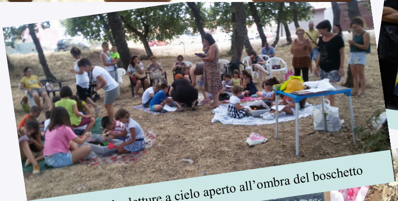
Flash Book... letture a cielo aperto all'ombra del boschetto