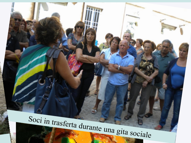
Soci in trasferta durante una gita sociale