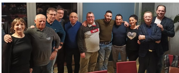
Il Direttivo 2020-2021 dell'Associazione Contrade Termoli Nord

Nel 2009 segnalò la nostra partecipazione ad un forum civico delle varie associazioni di Termoli con l'amministrazione comunale, esponendo le problematiche legate alla depurazione delle acque, alla viabilità e alla sicurezza stradale del quartiere che, negli anni, è stata soggetta da parte nostra a continui solleciti.