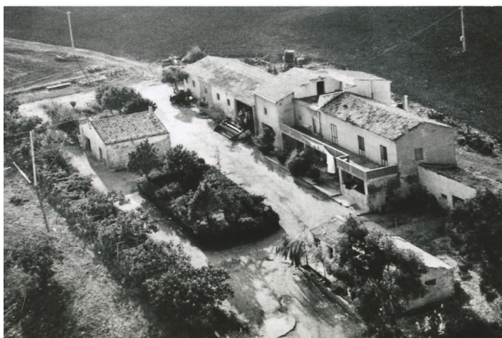
Veduta aerea della Masseria Longo, oggi in via Leopardi, prima della lottizzazione dell'area