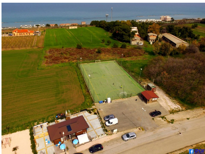
Veduta aerea di via Pascoli, 2020. In primo piano il Caffè dei Poeti e il campetto di calcio.