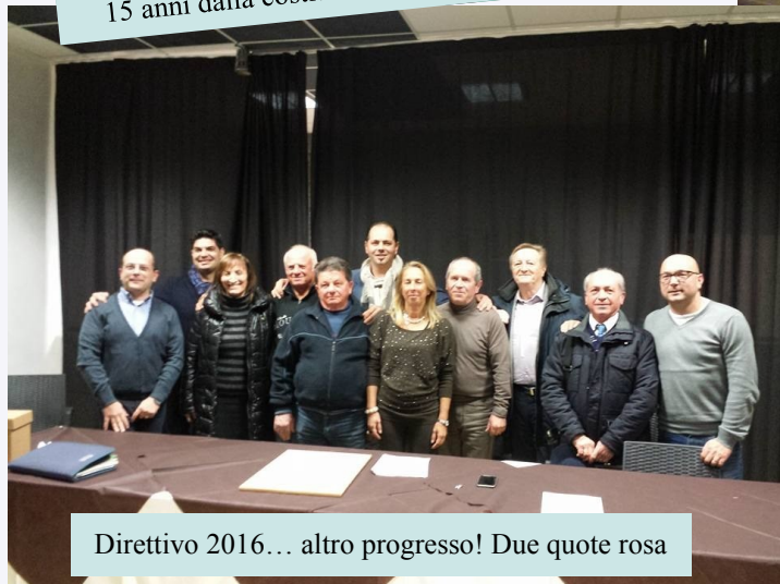
Direttivo 2016... altro progresso! Due quote rosa