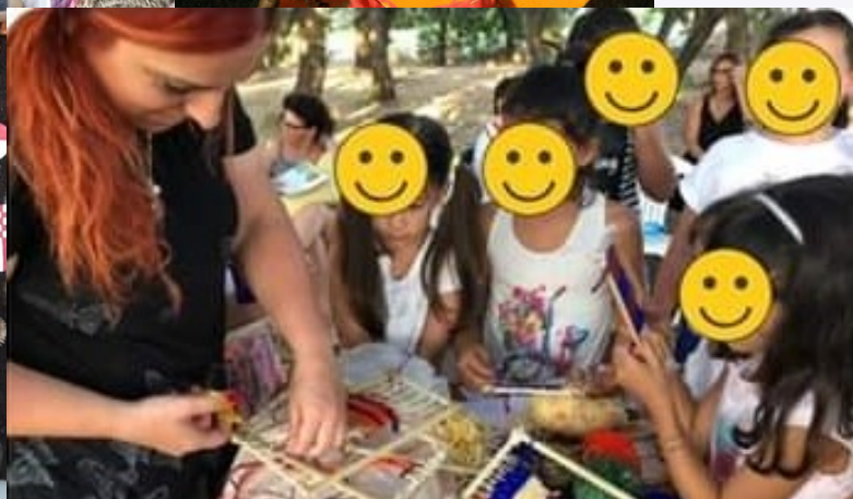
Laboratori didattici con Me.Mo. cantieri culturali